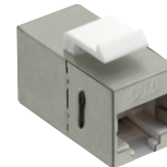
Part No. NK4011