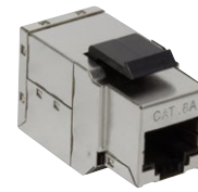
Part No. NK4010