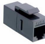
Part No. NK4012