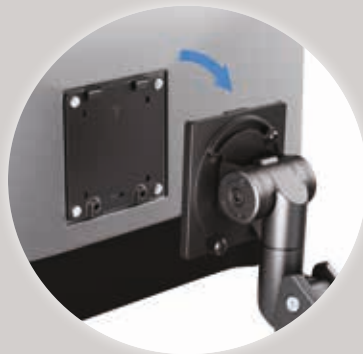
VESA-kompatibel VESA Compatible